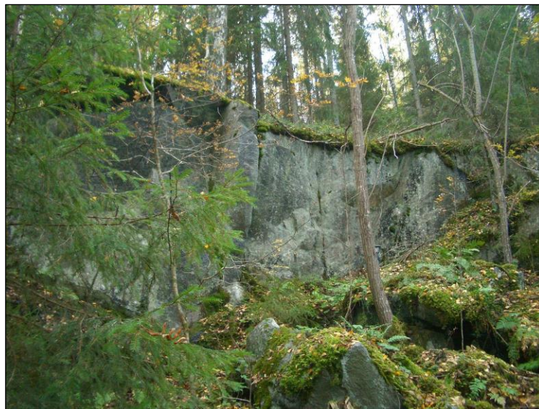
Yllä: kivilouhos tms., alla alueen maastoa